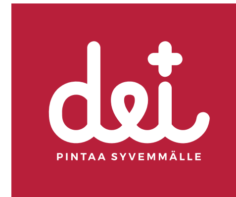
Logoteksti sloganilla negaversio. Käytettäväksi Dei+:n punaisella / tummalla pohjalla.