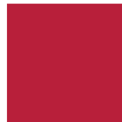
PMS 187 (painotuotteisiin)