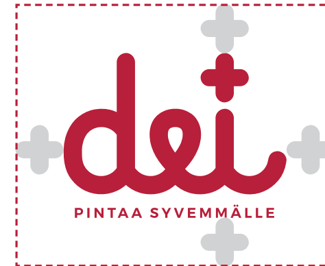
Suoja-alue: 1 x logoon sisältyvä plus-merkki.